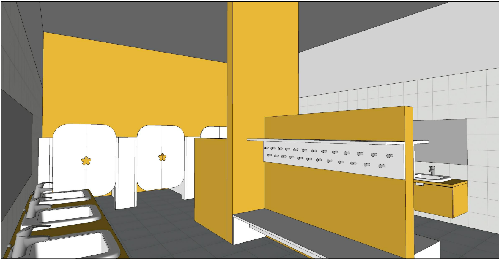
WIDOK 1 aranżacji wnętrza łazienki

UWAGA: -drzwi z płyty laminowanej w kolorze białym