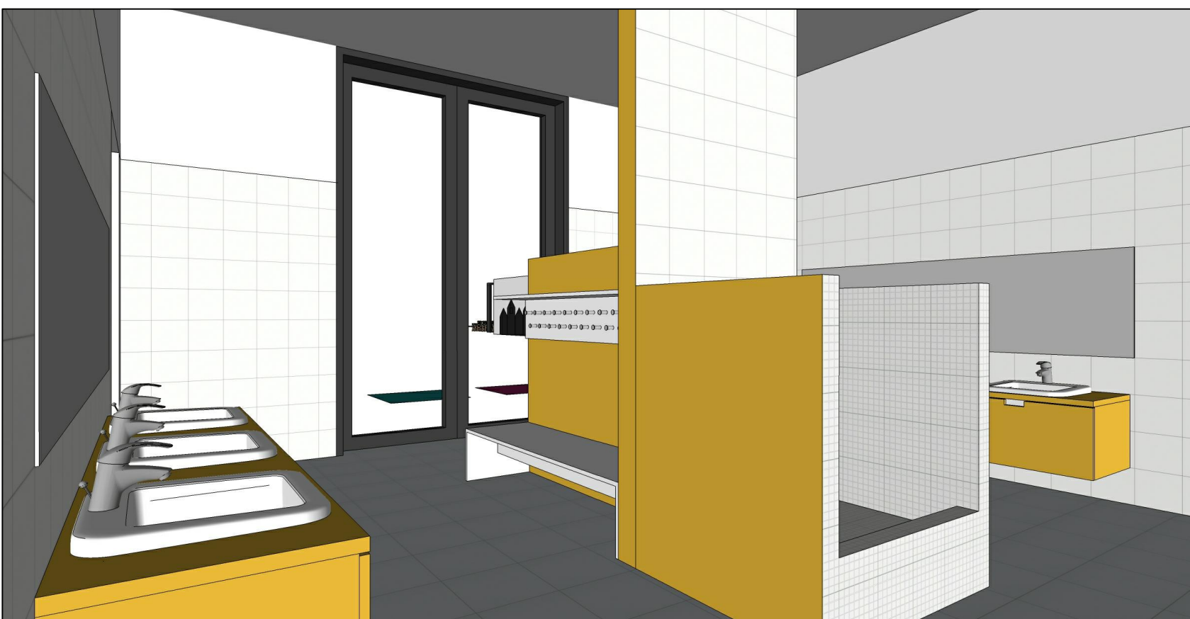
WIDOK 3 aranżacji wnętrza łazienki