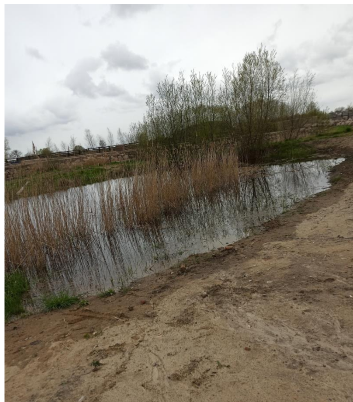
2. Staw, trzcina pospolita i wierzby iwa