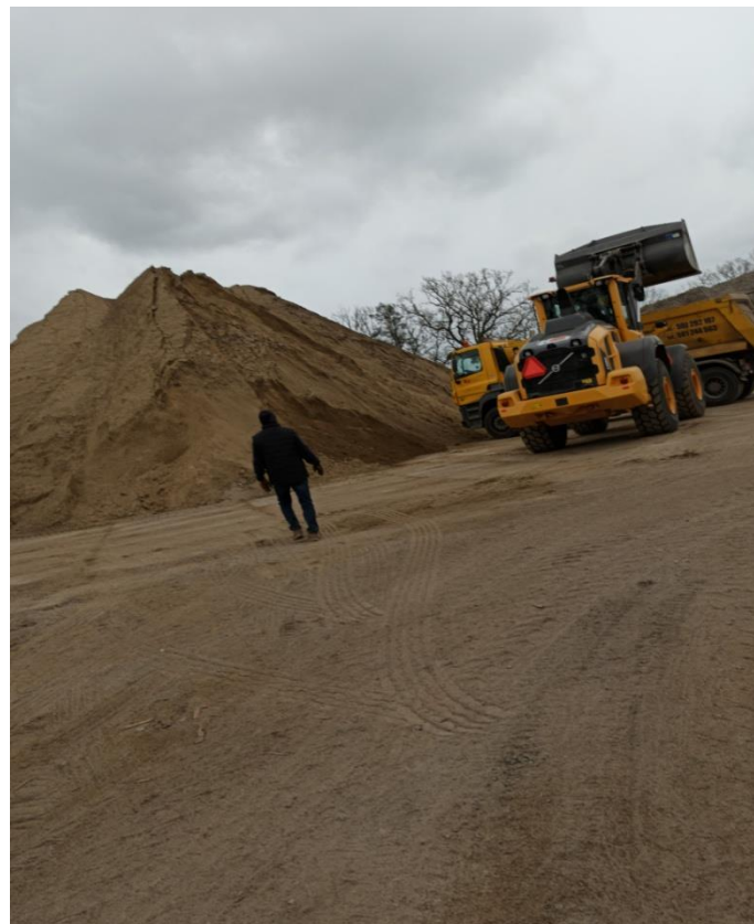
8. Plac magazynowy mat. sypkich