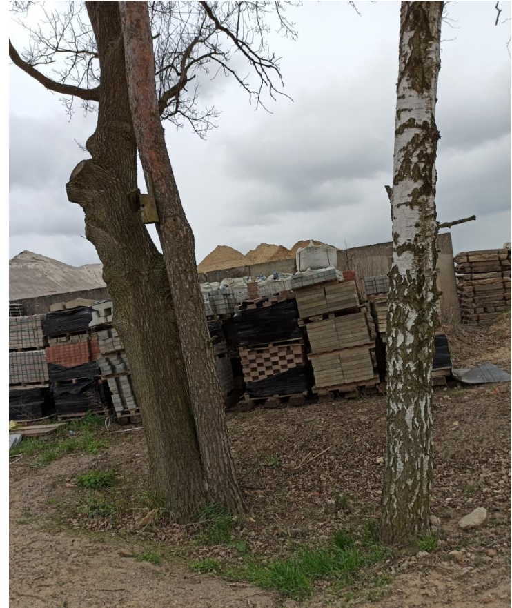
4. Boksy na materiały budowlane sypkie Lipa dwupienna (lp.14) brzoza (lp.15)