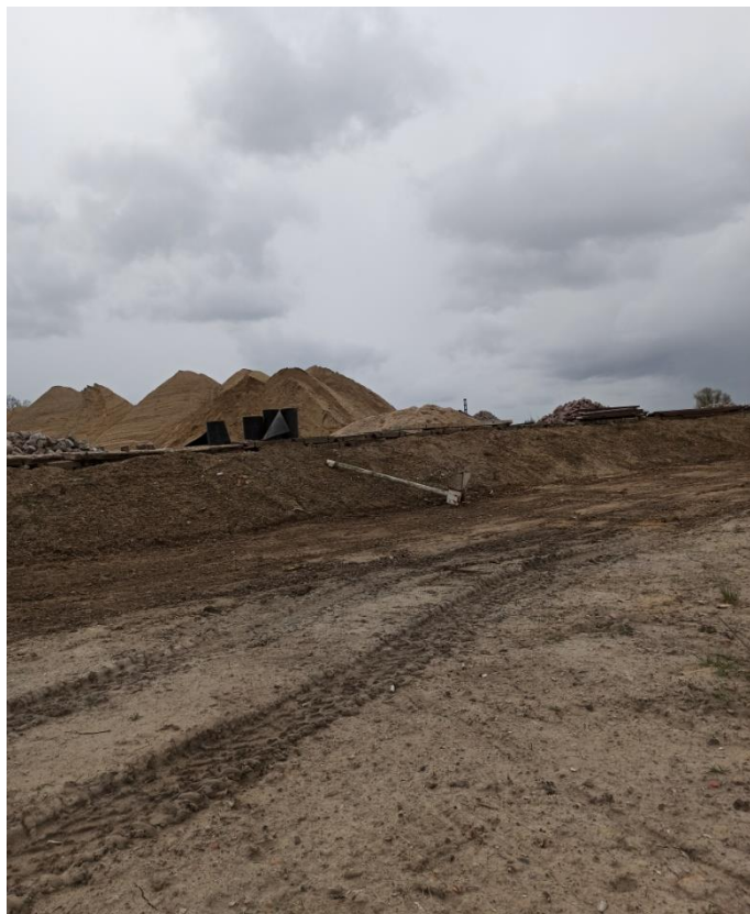
7. Zachodnia część terenu dz. 190/2 plac magazynowy materiałów sypkich- piasku, żwiru