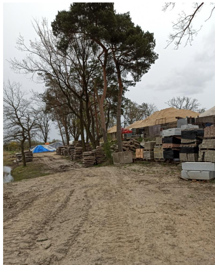
6. Północna część terenu dz. 190/2, sosny (lp.27, 28, 29)