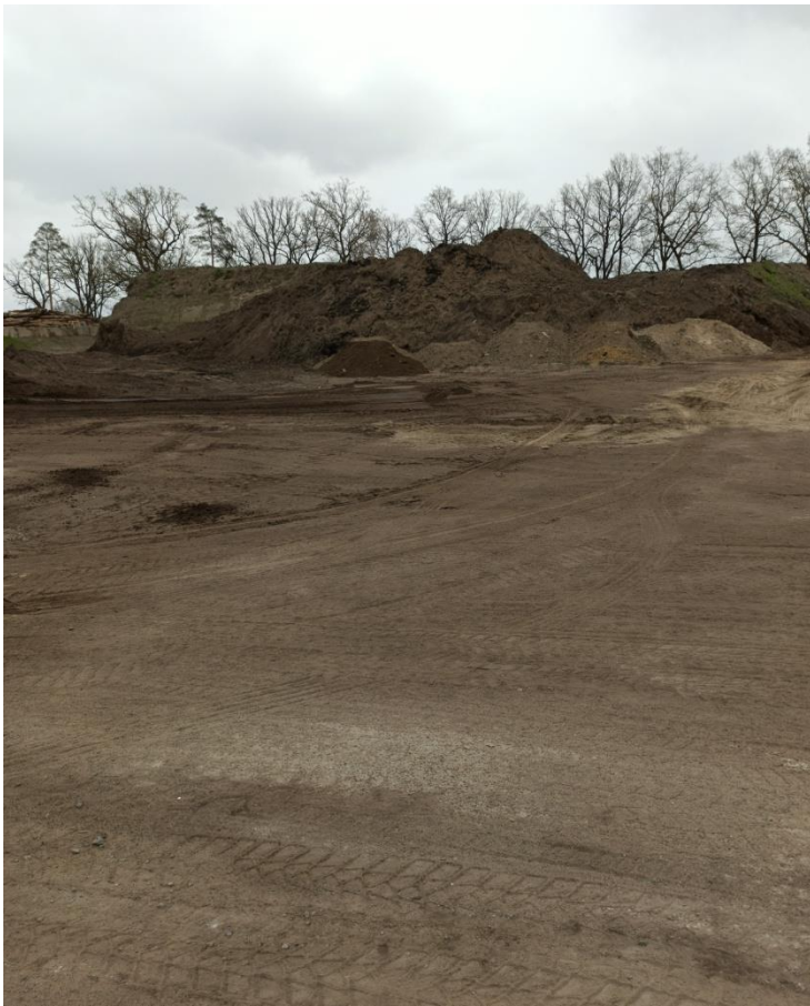
11. Miejsce magazynowania odpadów gleby i ziemi