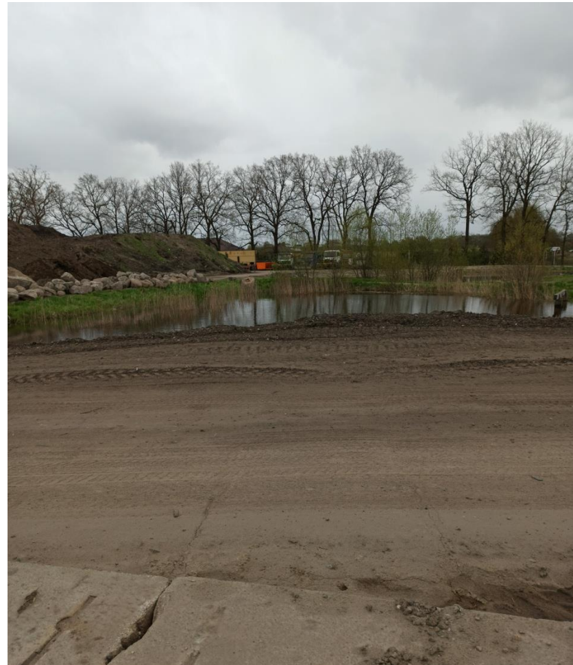
12. Widok od strony zachodniej na staw i miejsce magazynowania odpadów gleby i ziemi