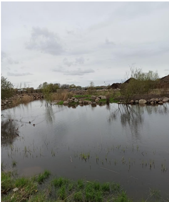
1. Staw, wierzba iwa(lp. 38-41), kaczki ( para lęgowa) za stawem miejsca magazynowania materiałów sypkich