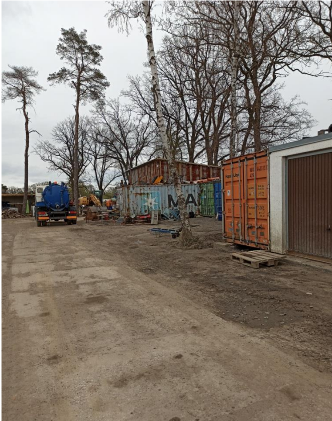
3. Wschodnia część terenu, dojazd do bazy warsztatowej sosny ( lp. 5,6) , brzoza (lp .2)