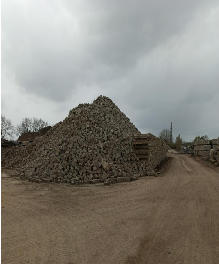
9. Plac magazynowy odpadów budowlanych