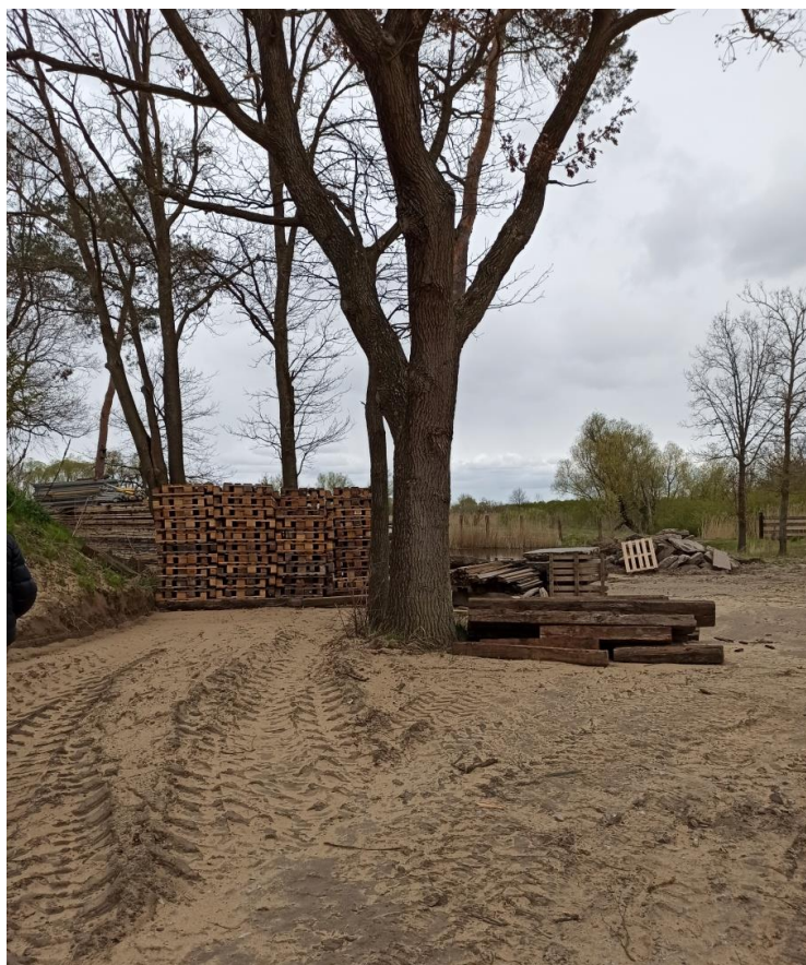
5. Północna część terenu dz. 190/2, lipa (lp.20) sosna (lp. 21, dąb (lp.22) wiąz (lp.23) sosna (lp. 24)