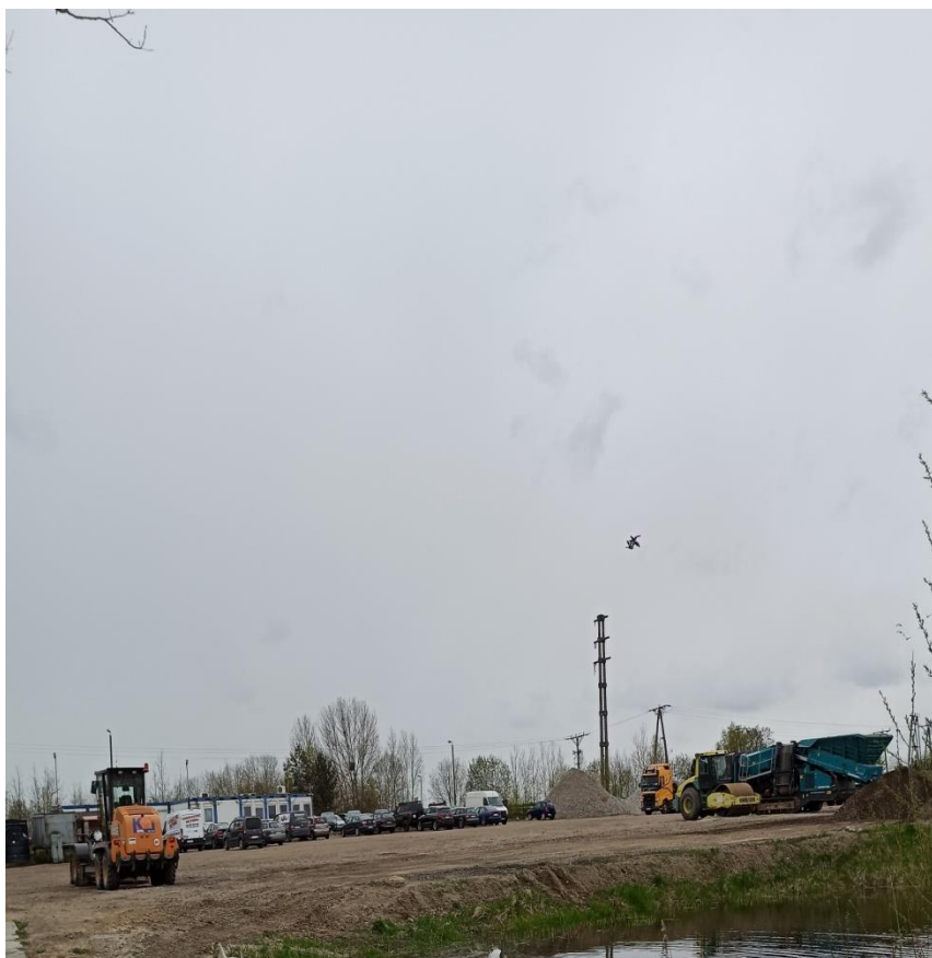
13. Kontenery socjalno-biurowe w południowej części dz. 190/2