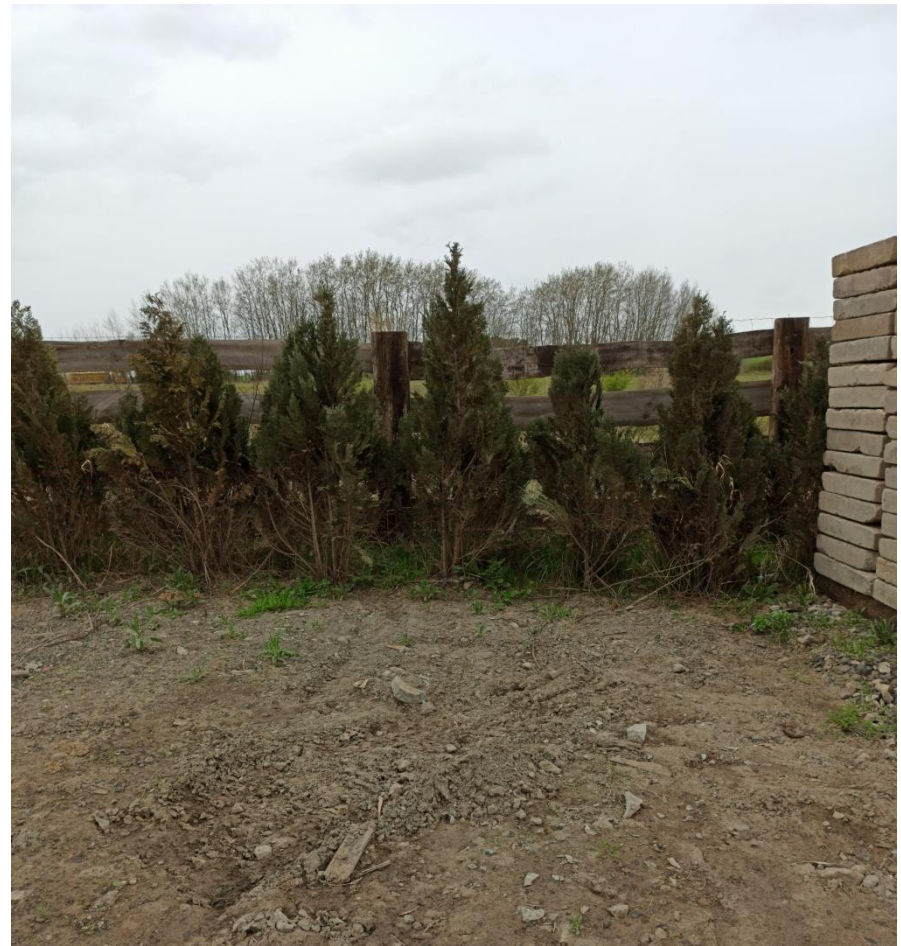
10. . Zachodnie ogrodzenie, szpaler tui (lp. 36)